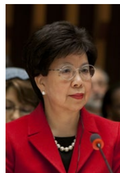
Margaret Chan Directeur général de l'OMS

Le cadre adopté pour l'Europe suit de près le 12 e programme général de travail de l'OMS et se veut l'expression pratique d'un programme de réforme de l'OMS qui vise à permettre à l'Organisation de répondre plus efficacement aux besoins des États Membres dans un monde en évolution rapide. Dans la Région européenne, comme ailleurs, les résultats envisagés dans ce cadre politique supposent que les organisations internationales soient capables d'œuvrer non pas avec certains ministères sectoriels seulement, mais avec toutes les parties intéressées du gouvernement; avec des collègues d'autres organisations internationales qui influent sur la santé; de même qu'avec l'industrie, les milieux universitaires et la société civile. Le cadre politique pour l'Europe balise la voie à suivre vers de nouvelles approches de la santé et du bien-être dans le monde.